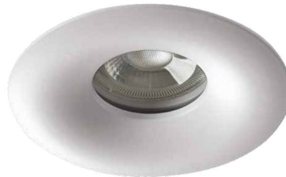
DROXY IP65 DSO-W 33125

Deux couleurs au choix: blanc mat et noir mat.